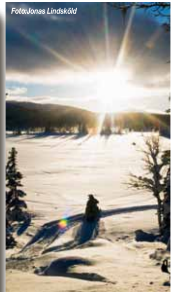
Det finns massor med små sjöar och myrar i området. Alldeles tillräckligt många för att alla ska kunna trasha en varsin om dagen.