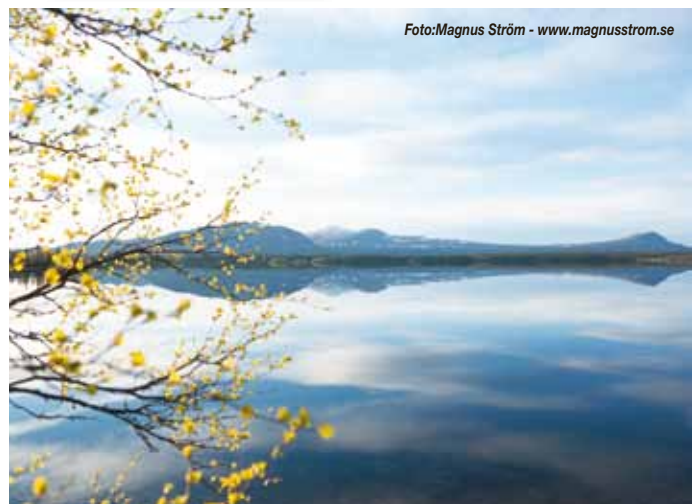
Är man skoternörd är det kanske inte lika roligt att besöka Saxnäs på sommaren. Men det är minst lika vackert.